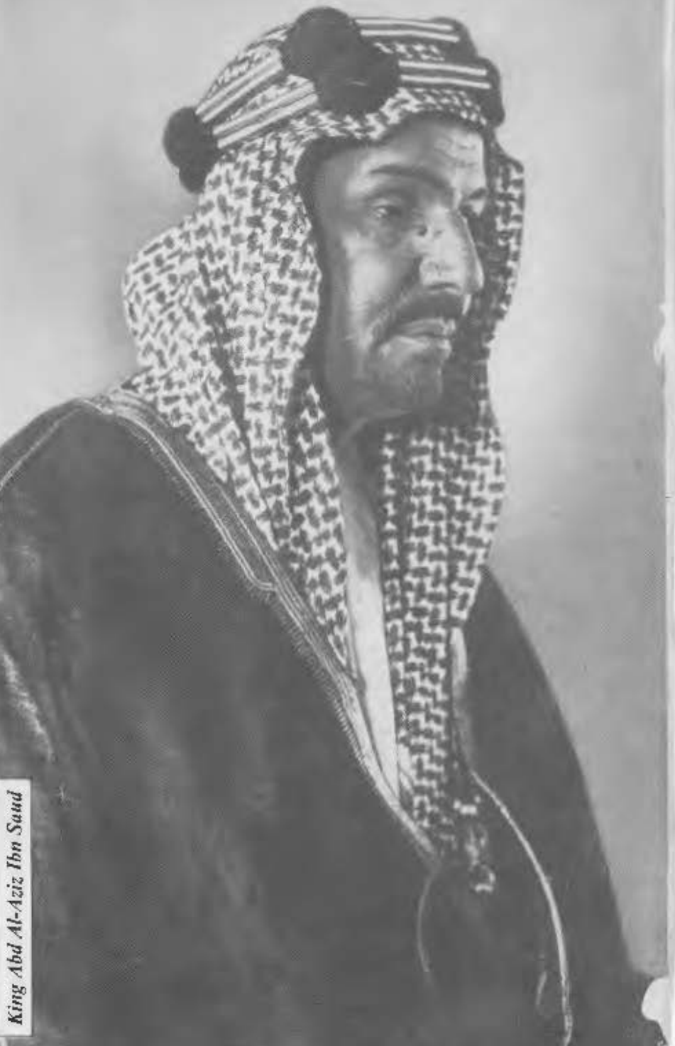
King Abd Al-Aziz Ibn Saud