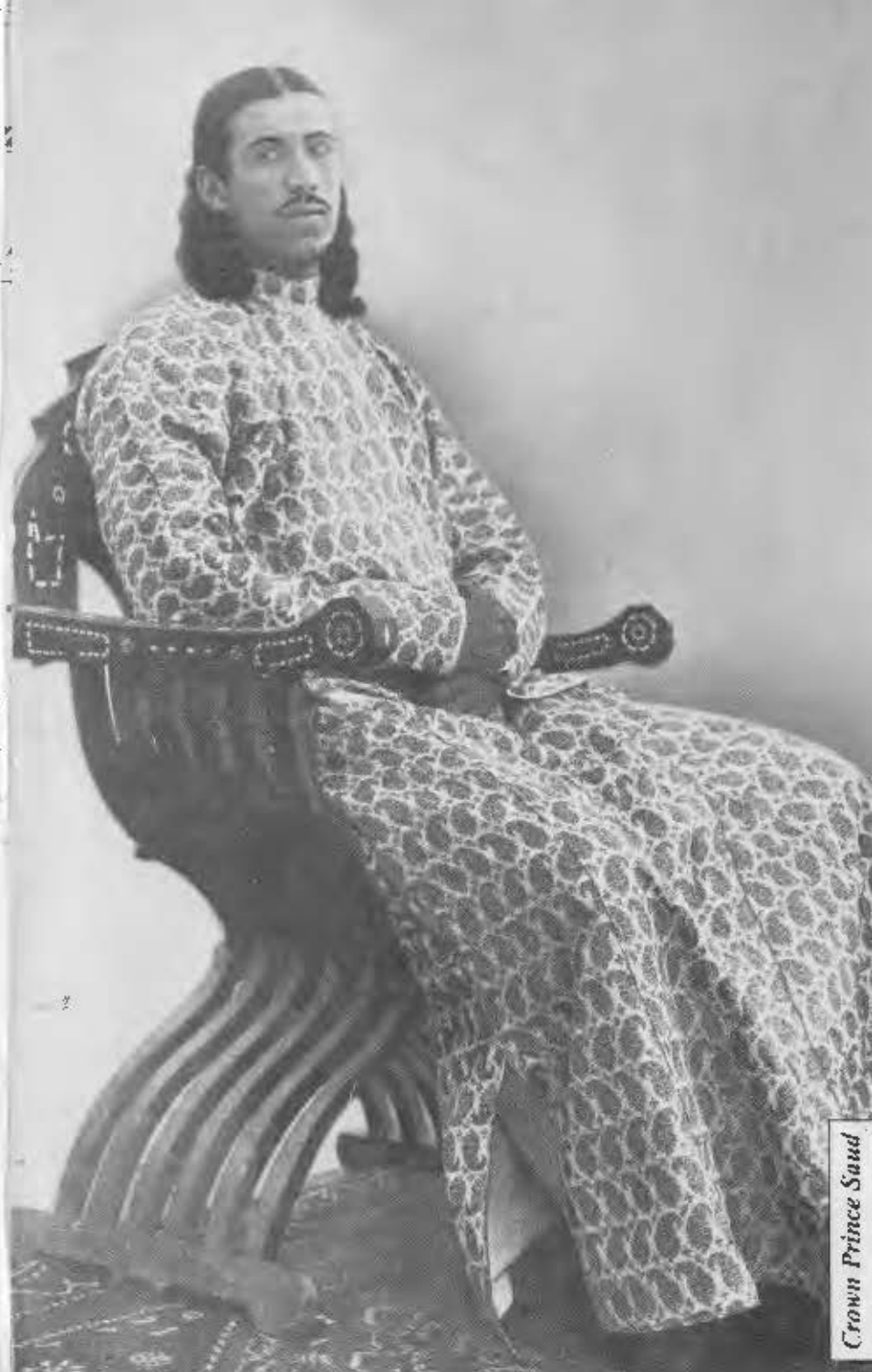
Crown Prince Saud