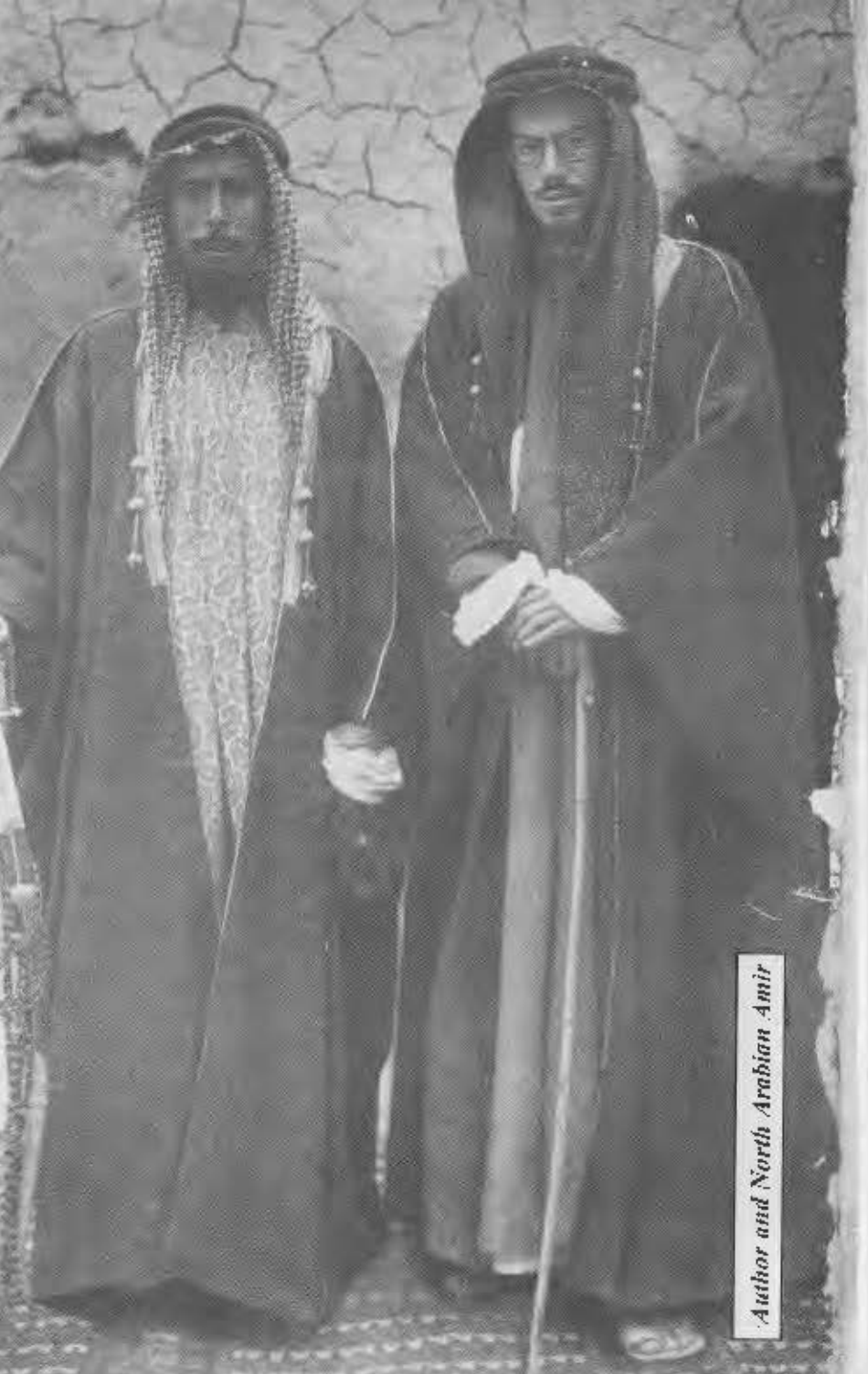
Author and North Arabian Amir