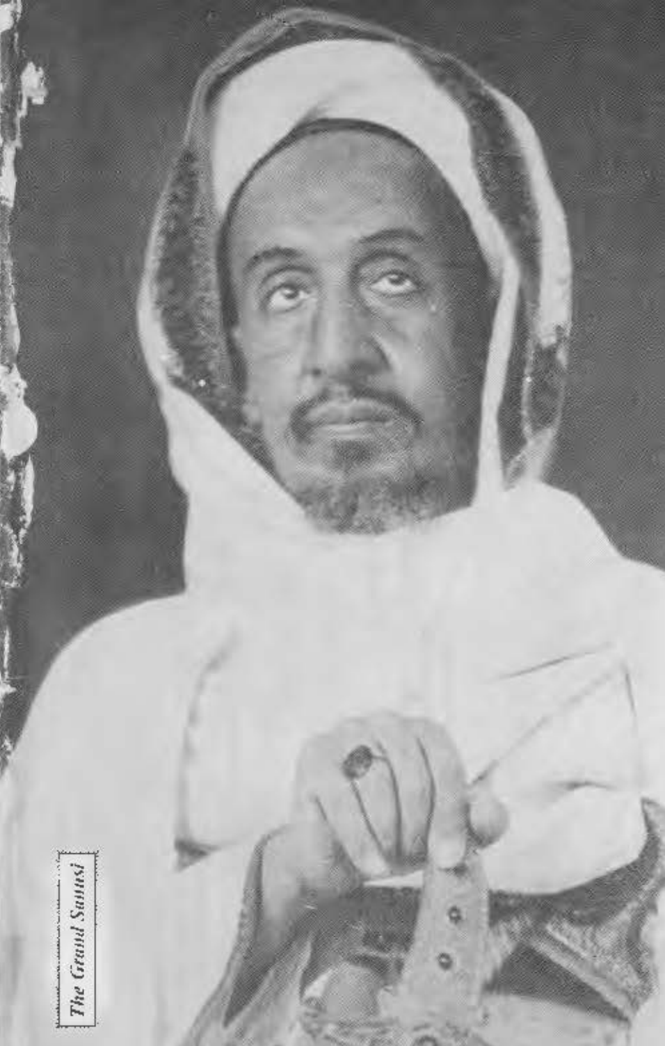
The Grand Saousi